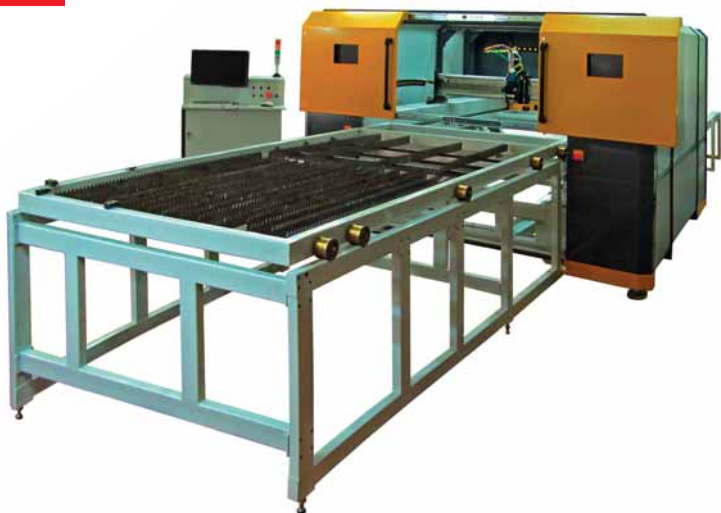
Рис. 1 Лазерная система МЛПЗ компании ЗАО НИИ ЭСТО (Россия) с высокоэффективными линейными двигателями НПЦ «Лазеры и аппаратура ТМ» (Россия) и волоконными лазерами «ИРЭ-Полюс» (Россия)